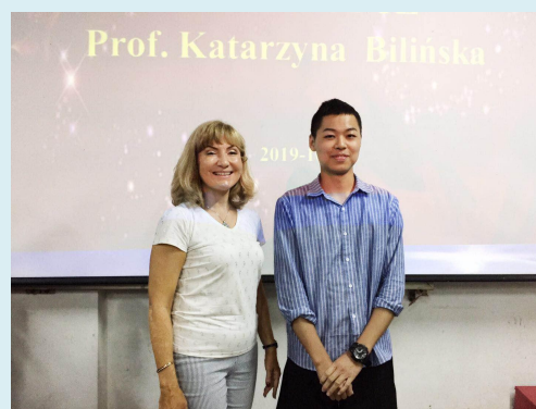
中德国际班学生与外籍教师合影