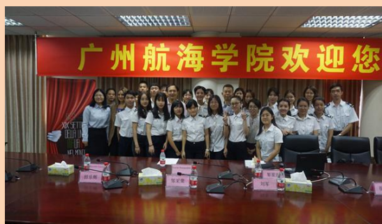
意大利驻广州总领事与我校学生亲切会面