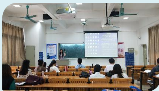
中德国际班德语课教学