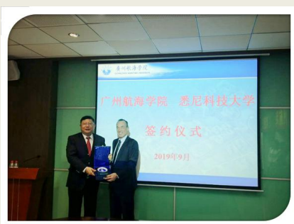
广航与悉尼科大签约仪式