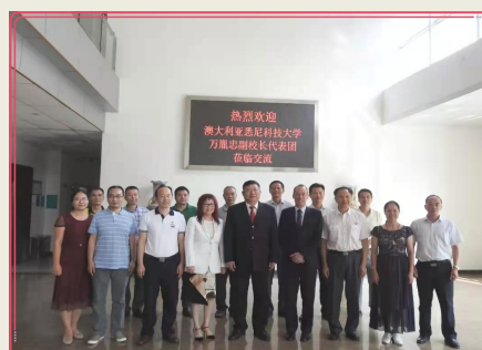
悉尼科技大学副校长一行来访