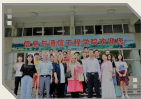
信通学院中外文化交流活动