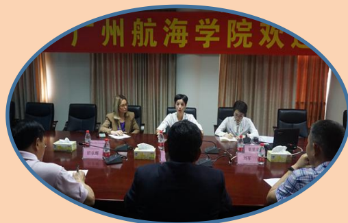
意大利驻广州总领事一行来访