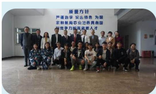
2019年“4+1”中德国际班开班仪式