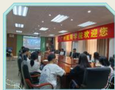
澳方合作大学线上学术讲座