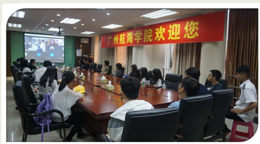
澳方合作大学新生见面会