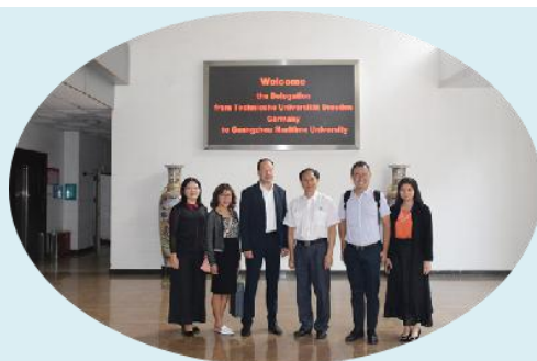
德累斯顿国际大学副校长一行来访