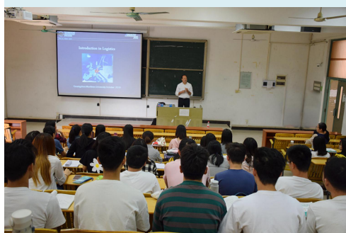
德累斯顿国际大学教授来校讲座